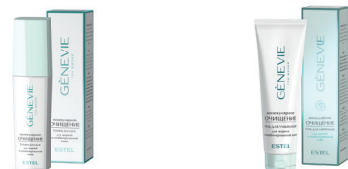
Тоник-баланс для жирной и комбинированной кожи Гель для умывания для жирной и комбинированной кожи