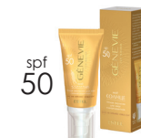
Лёгкая эмульсия для лица солнцезащитная SPF 50