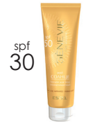
Крем-вуаль для лица и тела солнцезащитный SPF 30