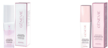
Двухфазный лосьон для снятия макияжа с экстрактом розы Молочко для снятия макияжа для чувствительной кожи