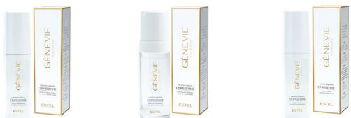
Мицеллярная вода для всех типов кожи Пенка для умывания для всех типов кожи Тоник-баланс для всех типов кожи