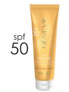
Лосьон для тела солнцезащитный SPF 50