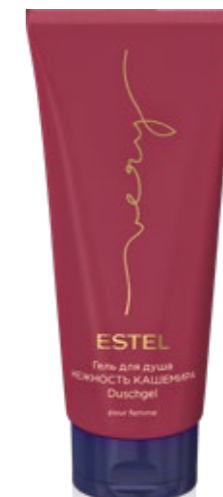
ГЕЛЬ ДЛЯ ДУША НЕЖНОСТЬ КАШЕМИРА ESTEL VERY 200 мл арт. EV/G200

Применение: нанесите на чистые влажные волосы, оставьте на 5-10 минут, смойте.