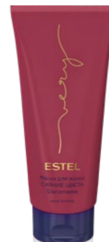
МАСКА ДЛЯ ВОЛОС СИЯНИЕ ЦВЕТА ESTEL VERY 200 мл арт. EV/M200

Подчёркивает богатство цвета и способствует его сохранению. Обеспечивает интенсивное увлажнение, наполняет волосы ароматом ESTEL VERY.