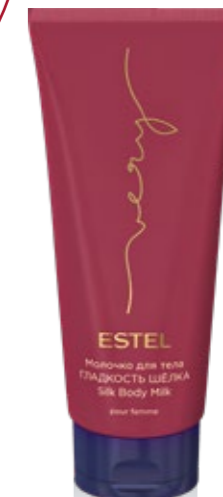
МОЛОЧКО ДЛЯ ТЕЛА ГЛАДКОСТЬ ШЁЛКА ESTEL VERY 200 мл арт. EV/200

Нежно очищает и увлажняет кожу. Придаёт ей мягкость кашемира. Оставляет на коже вкус аромата ESTEL VERY.