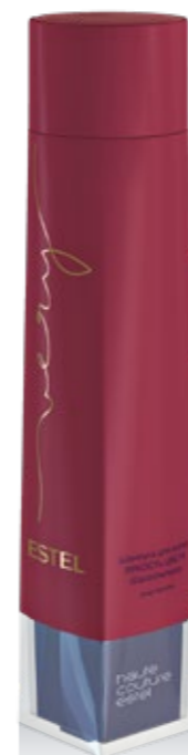
ШАМПУНЬ ДЛЯ ВОЛОС ЯРКОСТЬ ЦВЕТА ESTEL VERY 250 мл арт. EV/250

Подчёркивает богатство цвета и способствует его сохранению. Обеспечивает интенсивное увлажнение, наполняет волосы ароматом ESTEL VERY.