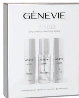
НАБОР GENEVIE SO PERFECT ПРОГРАММА ОЧИЩЕНИЯ КОЖИ 3x150 мл G/SET1/3 Мицеллярная вода Genevie So Perfect Пенка для умывания Genevie So Perfect Тоник-баланс Genevie So Perfect