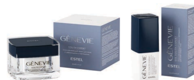
КРЕМ ДЛЯ КОЖИ ЛИЦА GENEVIE YOUTH EXPERT 50 мл арт. G/YE/50 Для возрастной категории 25+ Для любого типа кожи Сохранение молодости кожи за счёт активации внутренних систем, придание тактильного и визуаль- ного совершенства