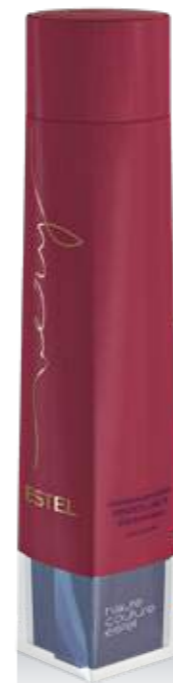
ШАМПУНЬ ДЛЯ ВОЛОС ЯРКОСТЬ ЦВЕТА ESTEL VERY 250 мл арт. EV/250

Подчёркивает богатство цвета и способствует его сохранению. Обеспечивает интенсивное увлажнение, наполняет волосы ароматом ESTEL VERY.