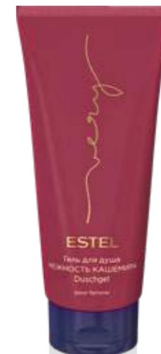
ГЕЛЬ ДЛЯ ДУША НЕЖНОСТЬ НАШЕМИРА ESTEL VERY 200 мл арт. EV/G200

Применение: нанесите на чистые влажные волосы, оставьте на 5-10 минут, смойте.