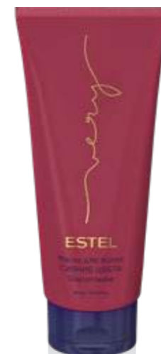
МАСКА ДЛЯ ВОЛОС СИЯНИЕ ЦВЕТА ESTEL VERY 200 мл арт. EV/M200

Подчёркивает богатство цвета и способствует его сохранению. Обеспечивает интенсивное увлажнение, наполняет волосы ароматом ESTEL VERY.