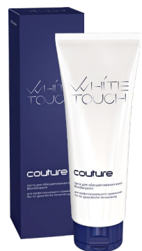
Паста для обесцвечивания WHITETOUGH ESTEL HAUTE COUTURE