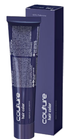
Краска для волос ESTEL HAUTE COUTURE