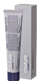
Краска для волос CRYSTAL BLOND ESTEL HAUTE COUTURE