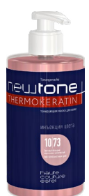
Тонирующая маска для волос NEWTONE ESTEL HAUTE COUTURE