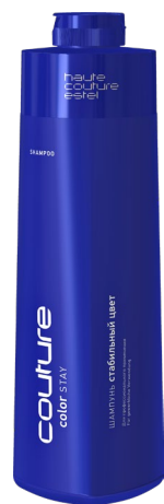
Шампунь Стабилизатор цвета COLOR STAY ESTEL HAUTE COUTURE