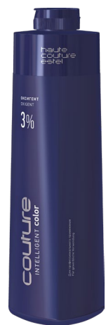
3% Оксигент для волос ESTEL HAUTE COUTURE