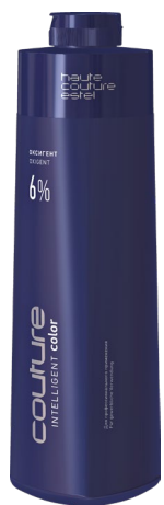
6% Оксигент для волос ESTEL HAUTE COUTURE