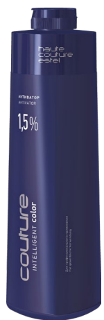
1,5% Активатор для волос ESTEL HAUTE COUTURE