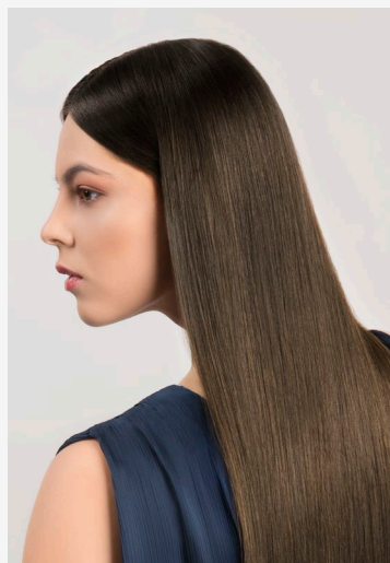
Натуральная база 5/0