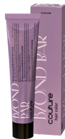
Краска для волос BLOND BAR ESTEL HAUTE COUTURE