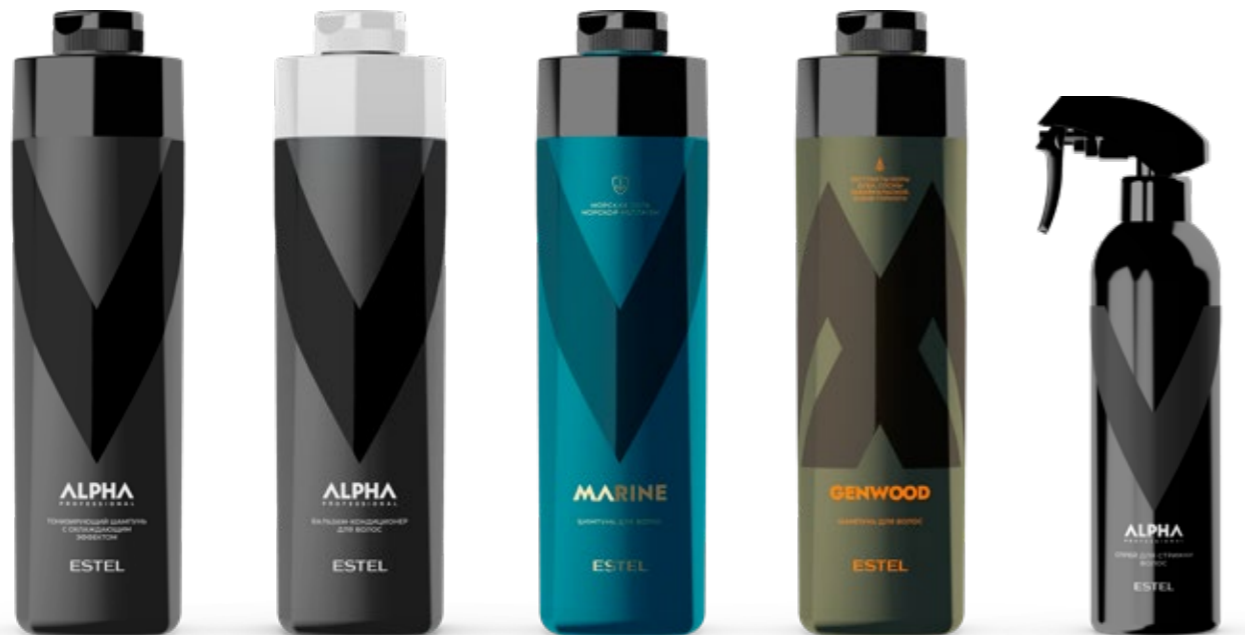
Тонизирующий шампунь с охлаждающим эффектом ESTEL ALPHA PRO 1000 мл | A/TS1000