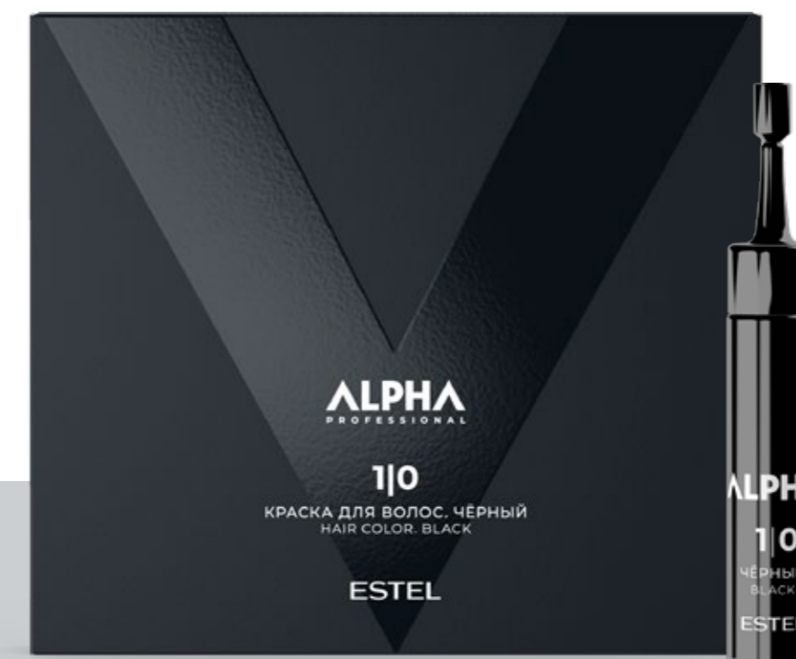
Краска для волос ESTEL ALPHA PRO