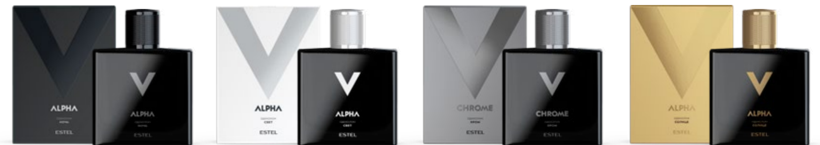
ОДЕКОЛОН ALPHA НОЧЬ 100 мл | AH/NT100 ОДЕКОЛОН ALPHA СВЕТ 100 мл | AH/SV100 ОДЕКОЛОН ALPHA ХРОМ 100 мл | AH/CR100 ОДЕКОЛОН ALPHA СОЛНЦЕ 100 мл | AH/SO100