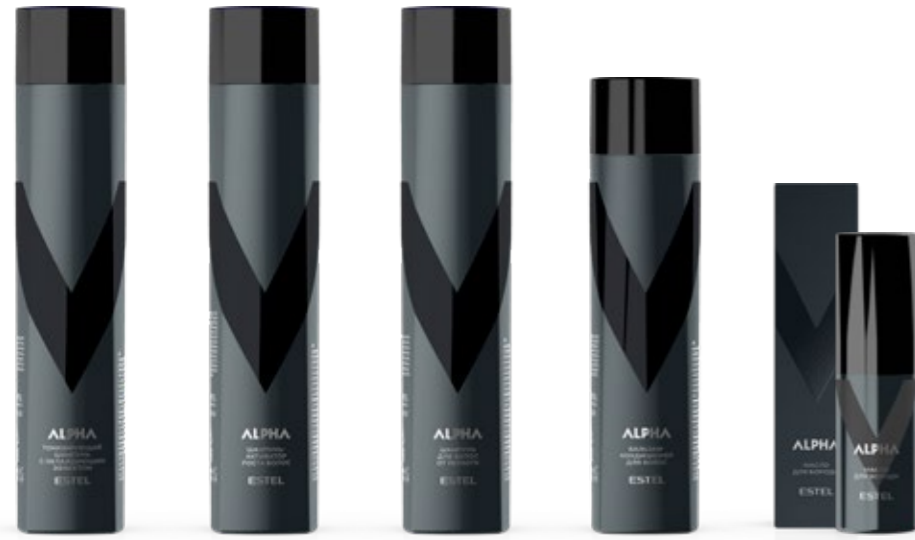
Тонизирующий шампунь для волос с охлаждающим эффектом ESTEL ALPHA 300 мл | A/TS300 Шампунь-активатор роста волос ESTEL ALPHA 300 мл | A/SA300 Шампунь для волос от перхоти ESTEL ALPHA 300 мл | A/SP300 Бальзам-кондиционер для волос ESTEL ALPHA 250 мл | A/B250