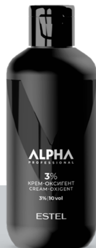
Крем-оксигент 3% ESTEL ALPHA PRO