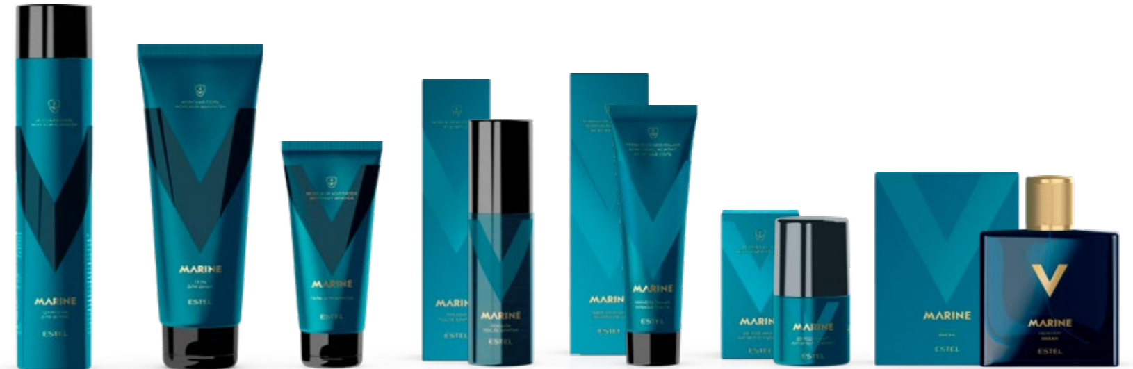
Шампунь для волос ESTEL ALPHA MARINE 300 мл | A/MS300 Гель для душа ESTEL ALPHA MARINE 250 мл | A/MG250 Гель для бритья ESTEL ALPHA 100 мл | A/MSG100 Лосьон после бритья ESTEL ALPHA MARINE 100 мл | A/ML100 Минеральная зубная паста ESTEL ALPHA MARINE 90 мл | A/MTP90 Дезодорант-антиперспирант ESTEL ALPHA MARINE 50 мл | A/MDA50 Одеколон ALPHA MARINE ОКЕАН 100 мл | AH/VO100