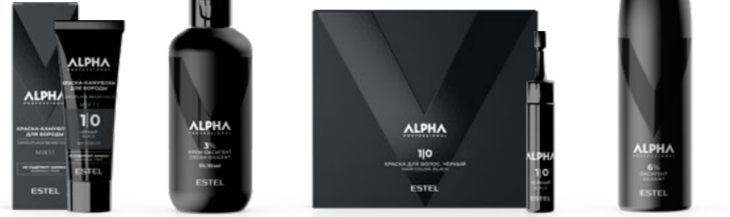
Краска-камуфляж для бороды ESTEL ALPHA PRO 40 мл | A/BC1/0, 4/0, 5/0, 6/0, 7/0