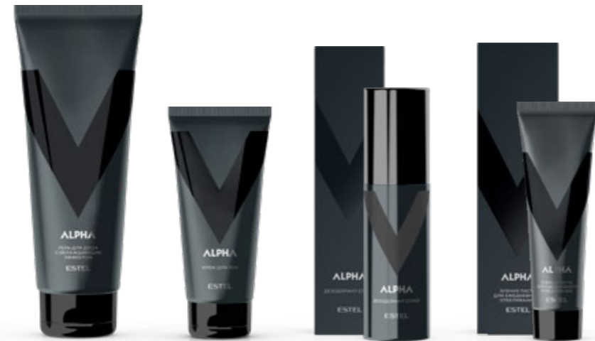
Гель для душа с охлаждающим эффектом ESTEL ALPHA 250 мл | A/G250 Крем для рук ESTEL ALPHA 100 мл | A/KR100 Дезодорант-спрей ESTEL ALPHA 100 мл | A/DS100 Зубная паста для ежедневного отбеливания ESTEL ALPHA 90 мл | A/TP90