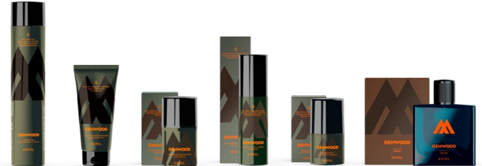
Шампунь для волос и тела ESTEL ALPHA GENWOOD 300 мл | A/GS300 Восстанавливающий крем для рук ESTEL ALPHA GENWOOD 100 мл | A/GKR100 Увлажняющий крем для лица ESTEL ALPHA GENWOOD 50 мл | A/GFK50 Дезодорант-спрей для ног ESTEL ALPHA GENWOOD 100 мл | A/GDI100 Дезодорант-антиперспирант ESTEL ALPHA GENWOOD 50 мл | A/GD50 Одеколон ALPHA GENWOOD ЗЕМЛЯ 100 мл | AH/ZM100