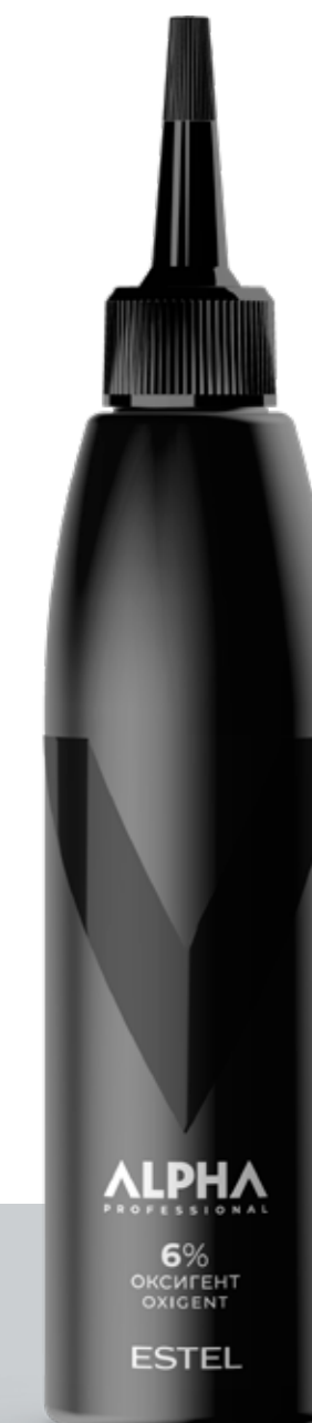
Оксигент 6% ESTEL ALPHA PRO