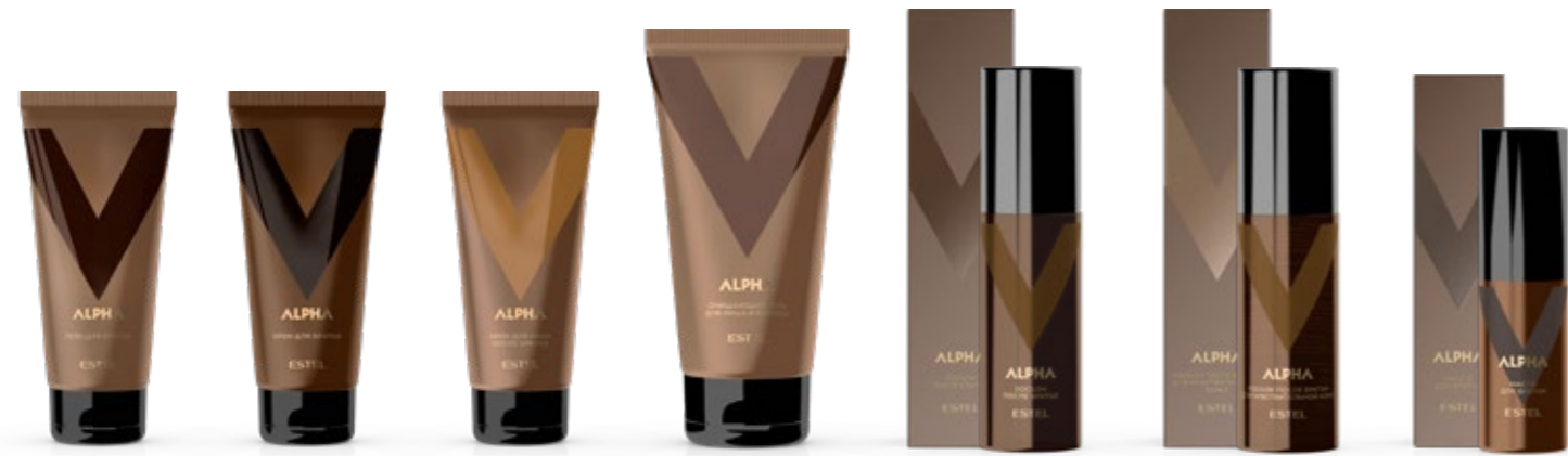
Гель для бритья ESTEL ALPHA 100 мл | A/SG100 Крем для бритья ESTEL ALPHA 100 мл | A/SC100 Крем для лица после бритья ESTEL ALPHA 100 мл | A/CAS100 Очищающий гель для лица и бороды ESTEL ALPHA 150 мл | A/CG150 Лосьон после бритья ESTEL ALPHA 100 мл | A/LA100 Лосьон после бритья для чувствительной кожи ESTEL ALPHA 100 мл | A/LS100 Масло для бритья ESTEL ALPHA 50 мл | A/SO50