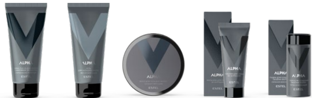
Крем-паста для волос с матовым эффектом нормальной фиксации ESTEL ALPHA 100 мл | A/CP100 Гель для укладки волос лёгкая фиксация ESTEL ALPHA 100 мл | A/LG100 Воск для укладки волос сильная фиксация ESTEL ALPHA 100 мл | A/SW100 Бальзам для ухода за бородой ESTEL ALPHA 30 мл | A/BB30 Пудра для создания объёма волос сильная фиксация ESTEL ALPHA 10 г | A/VP10