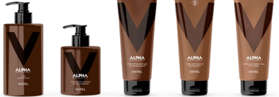
Гель для бритья ESTEL ALPHA PRO 435 мл | A/SG435