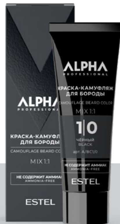
Краска-камуфляж для бороды ESTEL ALPHA PRO

ЕСТЕСТВЕННЫЕ ОТТЕНКИ И БЫСТРОЕ ДЕЙСТВИЕ. КАЖДЫЙ ВЫБИРАЕТ САМ: СЕДИНА ИЛИ ЦВЕТ. КАКИМ БЫ НИ БЫЛ ТВОЙ ВЫБОР, ОН ПРАВИЛЬНЫЙ.