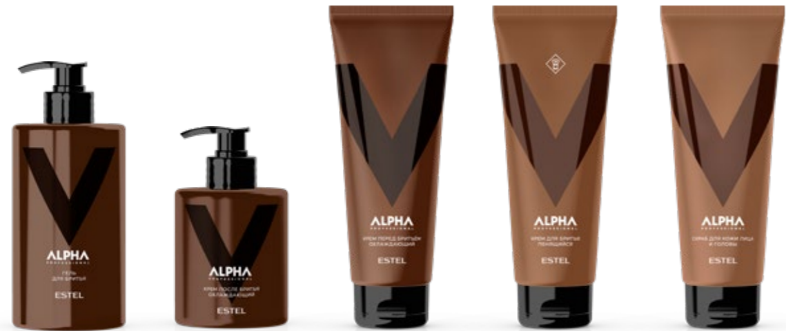
Гель для бритья ESTEL ALPHA PRO 435 мл | A/SG435