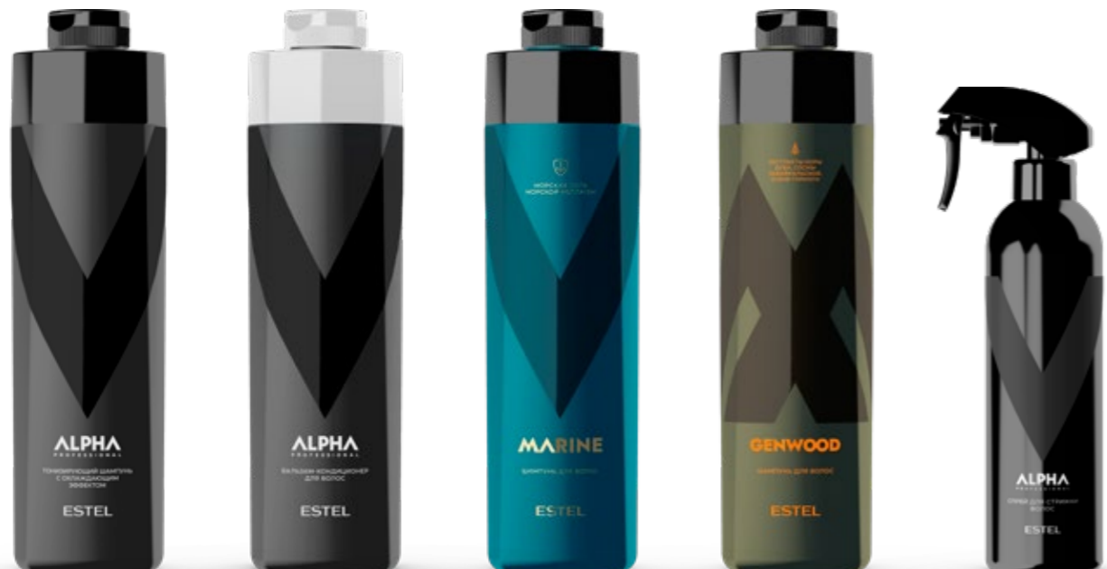
Тонизирующий шампунь с охлаждающим эффектом ESTEL ALPHA PRO 1000 мл | A/TS1000