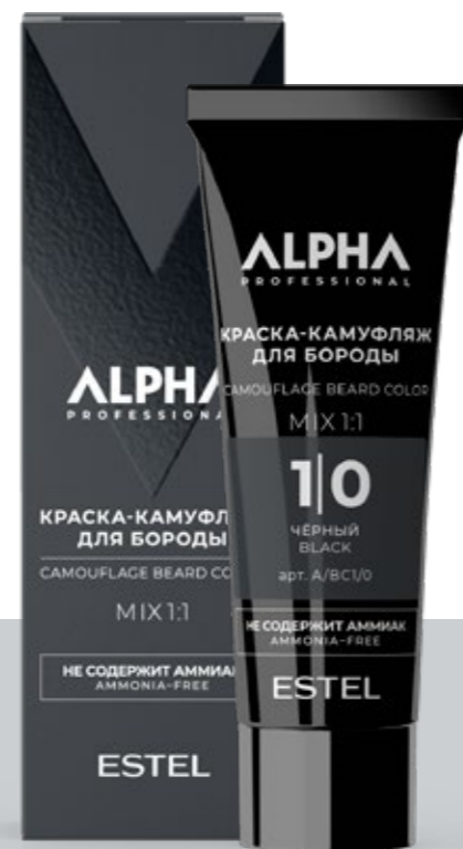
Краска-камуфляж для бороды ESTEL ALPHA PRO

ЕСТЕСТВЕННЫЕ ОТТЕНКИ И БЫСТРОЕ ДЕЙСТВИЕ. КАЖДЫЙ ВЫБИРАЕТ САМ: СЕДИНА ИЛИ ЦВЕТ. КАКИМ БЫ НИ БЫЛ ТВОЙ ВЫБОР, ОН ПРАВИЛЬНЫЙ.