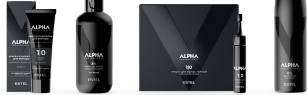
Краска-камуфляж для бороды ESTEL ALPHA PRO 40 мл | A/BC1/0, 4/0, 5/0, 6/0, 7/0