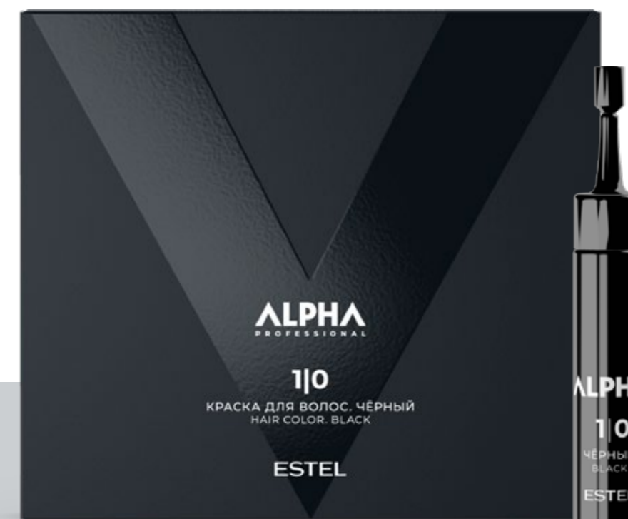
Краска для волос ESTEL ALPHA PRO