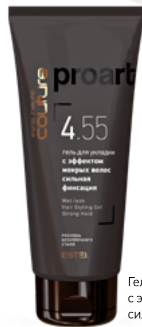
Гель для укладки с эффектом мокрых волос сильная фиксация