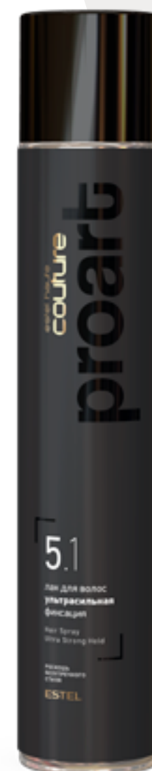
Лак для волос ультрасильная фиксация

Надёжно фиксируя, лак сохраняет естественность волос. Формула содержит полимеры, которые обеспечивают эффект уплотнения волос, сохраняя их подвижность. Полимеры обладают «памятью», благодаря чему укладка превосходно сохраняет свою форму. Влажность, ветер, занятия спортом, расчёсывание — при любых условиях причёска остаётся хорошо зафиксированной и абсолютно естественной.