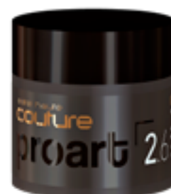
Моделирующая паста-крем для волос