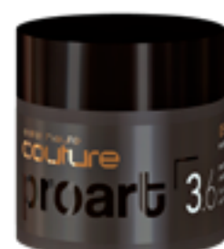
Текстурирующая глина-софт с матовым эффектом для волос