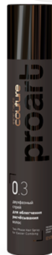
Двухфазный спрей для облегчения расчёсывания волос