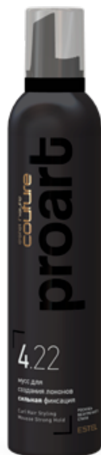
Мусс для создания локонов сильная фиксация

«Муссы рекомендуется наносить сразу после смывания бальзама, в мойке, для улучшения распределения. Затем волосы отжимают и приступают к укладке».