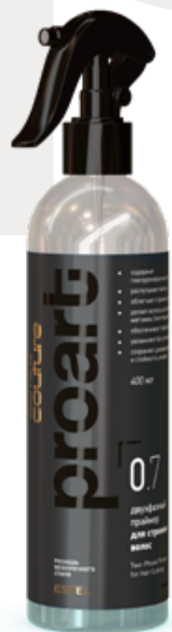
Двухфазный праймер для стрижки волос