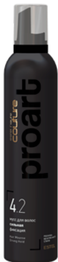
Мусс для волос сильная фиксация

«Хорошее средство для вытягивания волос, придающее фантастический блеск. Разглаживает и полирует волосы. Подходит для выделения гладких прядей в причёске, на которые потом можно нанести лак. Не рекомендуется наносить на корни. Применяется для счёсывания начёса».