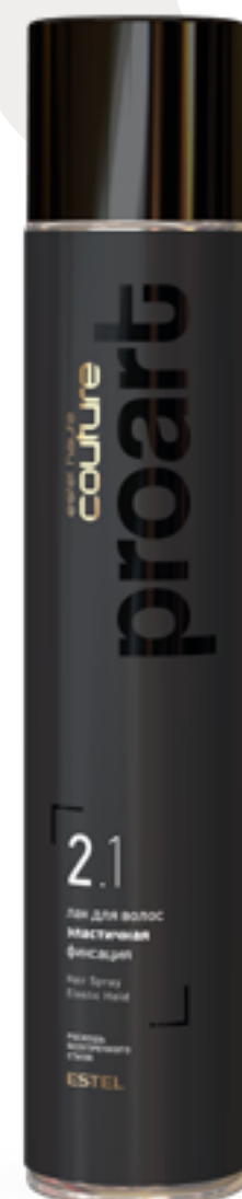
Лак для волос эластичная фиксация

«Дополнительная динамика волос и локонов. Обладает высоким уплотняющим свойством. Важно равномерно распределение, можно прочесать волосы пальцами или гребнем».