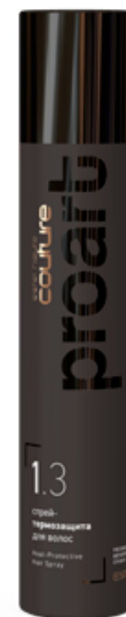
Спрей-термозащита для волос