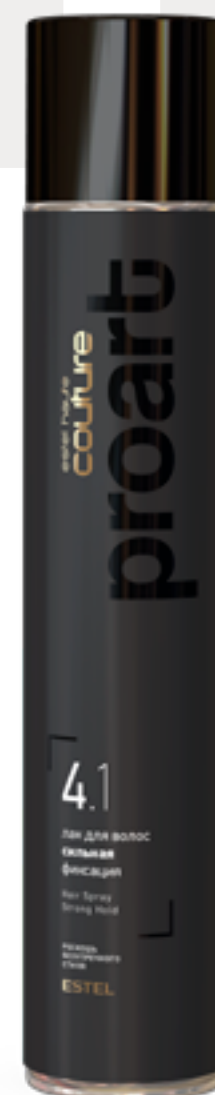
Лак для волос сильная фиксация

Фиксируя причёску, лак подчёркивает динамику волос и позволяет менять образ в течение дня. Дополнительно продукт придаёт волосам изысканный блеск и естественный объём.