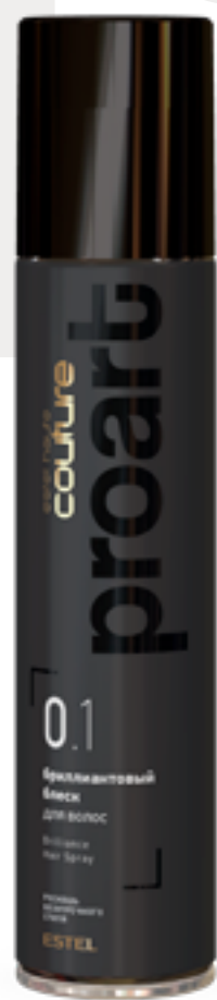
Бриллиантовый блеск для волос