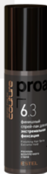
Финишный спрей-лак для волос экстремальная фиксация