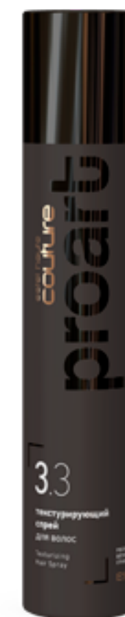
Текстурирующий спрей для волос