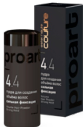
Пудра для создания объёма волос сильная фиксация

Идеально подходит для создания укладки «мокрый эффект». Создаёт «зеркальный» блеск на волосах за счёт формулы, которая содержит сорбитол. Обеспечивает долговременную фиксацию. Обладает лёгким увлажняющим действием. Глицерин и пантенол в составе геля эффективно увлажняют волосы, придавая им дополнительную гладкость и упругость. В сочетании с любым маслом HAUTE COUTURE отлично подходит для создания упругих и очерченных локонов: волосы становятся плотными, более динамичными и пластичными. Идеален для создания холодных волн.