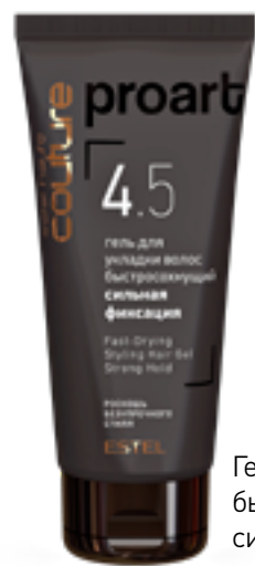
Гель для укладки волос быстросохнущий сильная фиксация