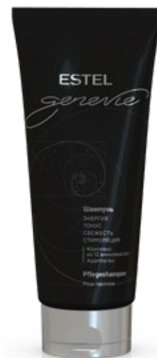
ШАМПУНЬ ДЛЯ ВОЛОС ESTEL GENEVIE POUR HOMME 200 мл арт. GHS/200

Компаньоны GENEVIE POUR HOMME обеспечивают профессиональный уход и исповедуют парфюмерные традиции аромата самой жизни — GENEVIE POUR HOMME.