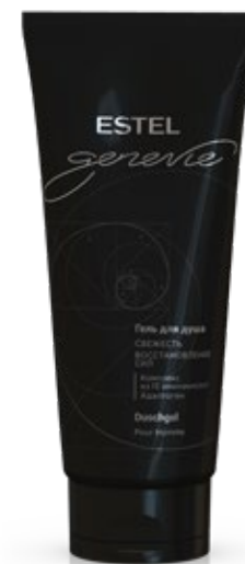
ГЕЛЬ ДЛЯ ДУША ESTEL GENEVIE POUR HOMME 200 мл арт. GHG/200

Применение: нанести небольшое количество шампуня на влажные волосы, помассировать, смыть.