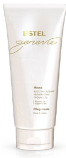
МАСКА ДЛЯ ВОЛОС ESTEL GENEVIE POUR FEMME 200 мл арт. GFM/200

Применение: нанести небольшое количество шампуня на влажные волосы, помассировать, смыть.