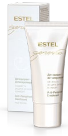
ДЕЗОДОРАНТ-АНТИПЕРСПИРАНТ ESTEL GENEVIE POUR FEMME 50 мл арт. GFD/50

Компаньоны следуют своему призванию, оставляя тайну аромата до конца неразгаданной, но доступной для интерпретации.