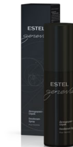
ДЕЗОДОРАНТ-СПРЕЙ ESTEL GENEVIE POUR HOMME 100 мл арт. GHD/100

Применение: нанести на тело или мочалку, вспенить, смыть.