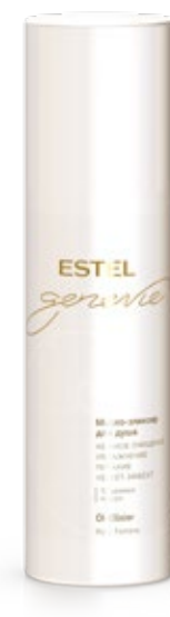
МАСЛО-ЭЛИКСИР ДЛЯ ДУША ESTEL GENEVIE POUR FEMME 200 мл арт. GFO/200

Применение: интенсивно встряхнуть флакон, распылить на чистые сухие или влажные волосы.