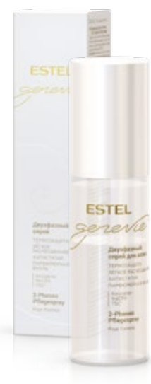
ДВУХФАЗНЫЙ СПРЕЙ ДЛЯ ВОЛОС ESTEL GENEVIE POUR FEMME 100 мл арт. GFS/100

Применение: нанести на влажные волосы, оставить на 3–5 минут, тщательно смыть.