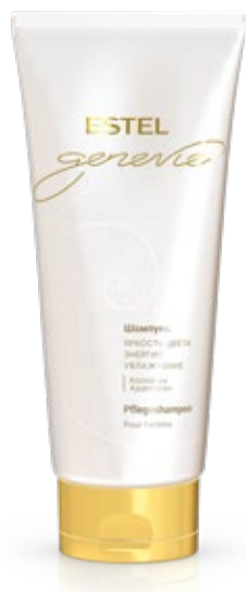
ШАМПУНЬ ДЛЯ ВОЛОС ESTEL GENEVIE POUR FEMME 200 мл арт. GFS/200

Дарит волосам жизненную силу и энергию. Интенсивно увлажняет, «возрождает» волосы по всей длине, обеспечивает плотность и сияние. Обволакивает тонким ароматом GENEVIE.